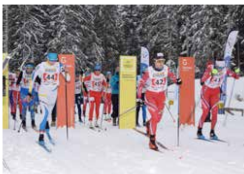
Le Col de Porte est le théâtre de compétitions nationales de ski de fond et de biathlon.