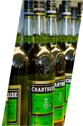
LIQUEUR DE CHARTREUSE 1605