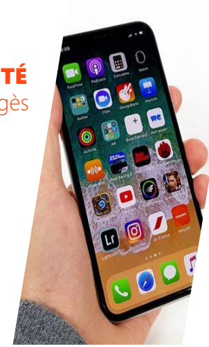
IPHONE Technologie SOI STMicroelectronics