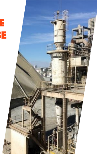
CIMENT VICAT 1818