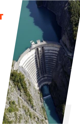
HYDRO ÉLECTRICITÉ Aristide Bergès 1818